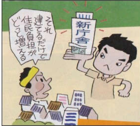
大事な施設・施策も「二重行政」といつて目の敵にする維新の会